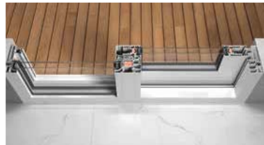
6700i 2 Lift & Slide (έκδοση με σταθερό τμήμα)