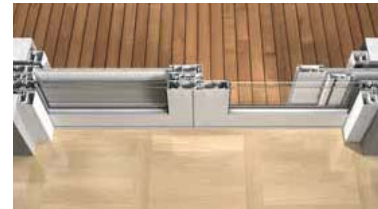
6500 Lift & Slide (δίφυλλη φιλητή κατασκευή)